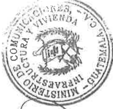
José Edmundo Lémus Cifuentes Ministro de Comunicaciones, Infraestructura y Vivienda